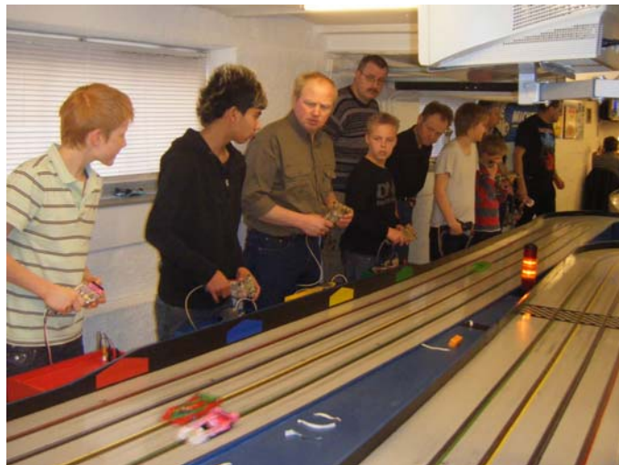
Trængsel under træningen i Aalborg!