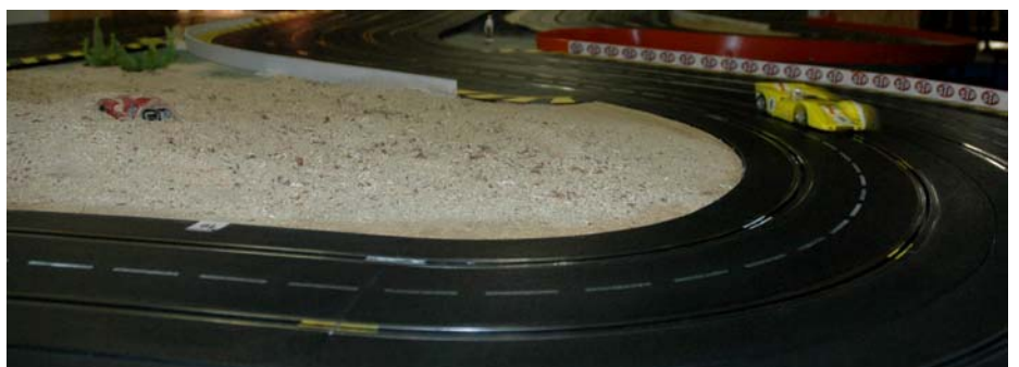
En enlig CanAm-racer på vej gennem Kilderingens ørkenlandskab!

Sådan en lille ting røg Randers i under anden runde. En afkørsel i ørkenen! Av-av - efter en tur i ørkenen på Kilderingen varer det nogen tid inden dækkene er helt optimale igen. Oveni dette blev banen også svinet til, så alle måtte køre særdeles forsigtigt i nogle omgange. Sikken et drama og det vendte da også stillingen foran på hovedet: Efter lidt over halvanden times kørsel førte Neckcheese nu med én omgang foran Randers. Sikker føring? Nej, ikke ligefrem. Grumpy Old Men måtte heller