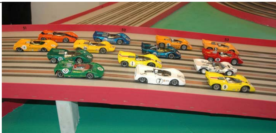
En drabelig kamp i Formel 1 mellem „Dan Gurney“ i Eagle Weslake og „Bruce McLaren“ i McLaren M2!

Der havde været hård kamp om placeringerne ved sidste løb i Billund og der var da også lagt op til et godt løb.