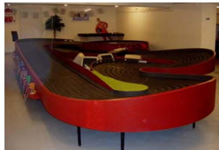
Banen sidste sted i opstillet tilstand hos RaceFun i Rødovre!