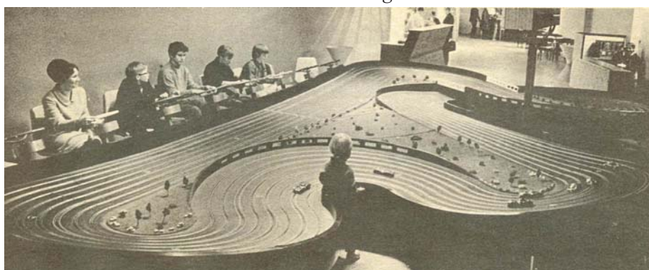
AMF Royal 95 banen opstillet i Århus-Hallen i 1967!