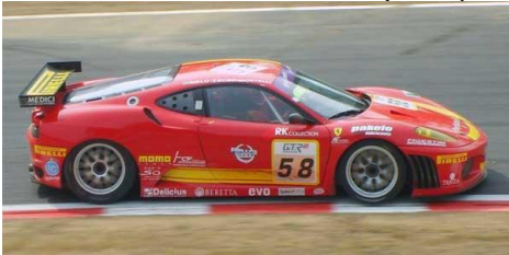
Ferrari 430 GT (Tamiya+Revell)