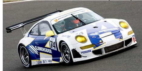
Porsche 997 RSR (Scaleprod.)