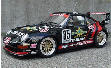
Porsche 911 GT2 (Tamiya)