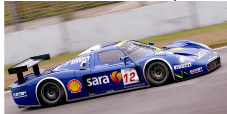
Maserati MC 12 (Nick de W)