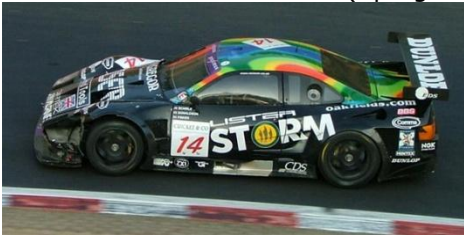
Lister Storm