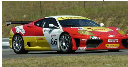
Ferrari 360 Modena (Revell+Tamiya)