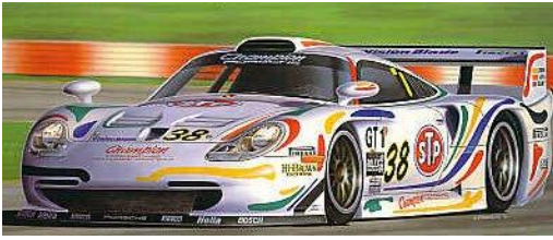
Porsche 911 GT1 1997 (Revell/slotworld)