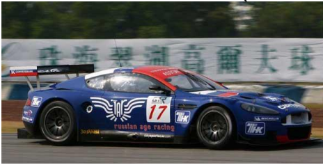
Aston Martin DBR9