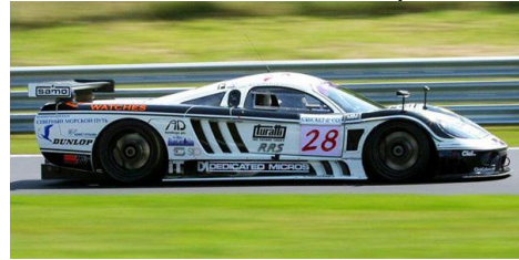
Saleen S7R (Cursa-slotworld)