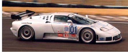
Bugatti EB 110SS (Revell+Heller)