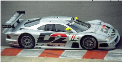
Mercedes CLK-GTR (Tamiya)