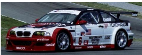
BMW M3 GTR E36/E46 (Dickie)