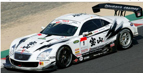
Toyota Lexus (Tamiya)