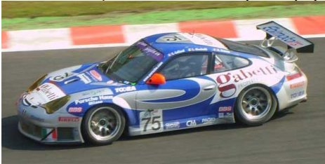
Porsche 911/996 GT3 RS (Tamiya)