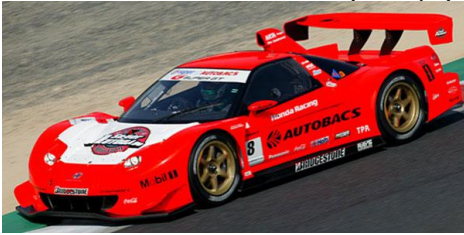
Honda NSX 2005 (Tamiya)