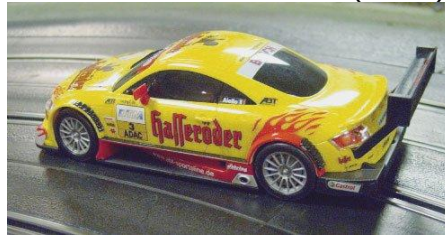
Audi TT-R (Dickie)