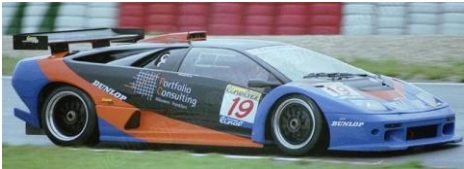
Lambo Diablo SV (Fujimi+Revell)