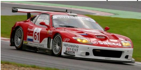
Ferrari 575 GTC (Carrera)