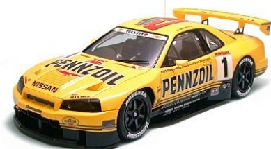
Nissan Skyline GT-R (Tamiya)