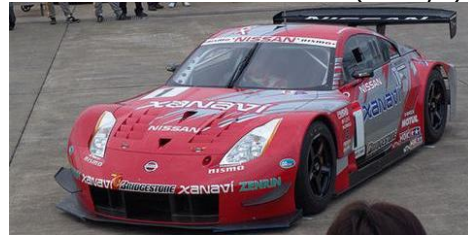
Nissan 350Z (Tamiya)