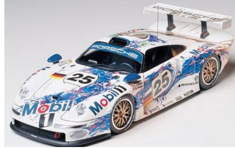
Porsche 911 GT1 1996 (Tamiya)