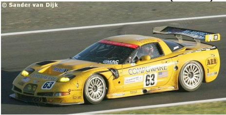
Corvette C5-R (Revell)