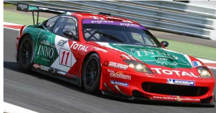
Ferrari 550 GTO (Scaleprod.)