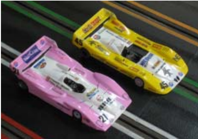
2.- & 3.-plads bilerne (placeret rigtigt!)